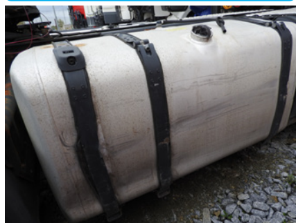
Wgniecenia i odkształcenia zbiornika paliwa.