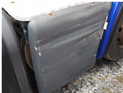
Wgniecenia, zadrapania lub pęknięcia.