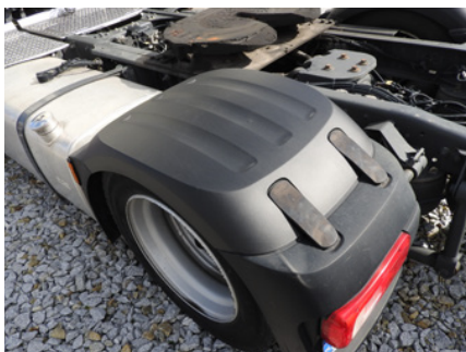
Drobne zadrapania oraz wgnięcia na nadkolach.