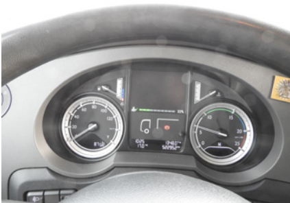
Brak uszkodzeń, brak sygnalizacji błędów lub nieprawidłowego działania.