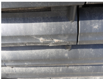
Pęknięcie kraty wlotu powietrza.