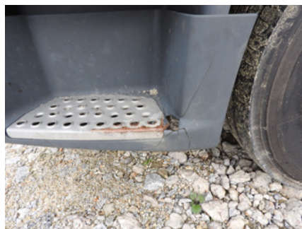
Pęknięcia, głębokie zadrapania.