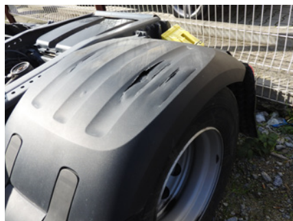
Mocne zadrapania, deformacje oraz otwory lub brak nadkola.