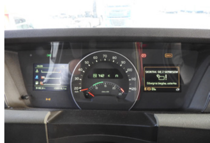
Informacja o błędach w układach pojazdu, świecą się kontrolki.

We wnętrzu powinien być neutralny zapach. Elementy deski rozdzielczej i zabudowy kabiny nie mają takich uszkodzeń, jak: nawiercenia, ślady po wkrętach, przepalenia tapicerki foteli, przetarcia tapicerki foteli czy nadmierne zużycie przełączników i kierownicy. Wyposażenie zgadza się ze specyfikacją zamówienia pojazdu, czyli zawiera gaśnicę, trójkąt ostrzegawczy, koło zapasowe i inne części wskazane w zamówieniu. Razem z pojazdem oddajesz książkę serwisową, instrukcję obsługi, etui, zielone karty normy emisji spalin oraz certyfikatu hałasu.