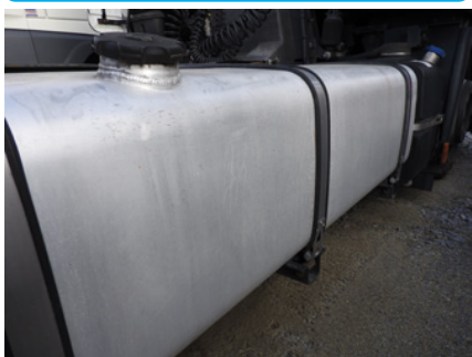
Ślady zużycia wynikające z codziennego użytku.