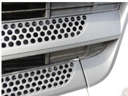
Niewielkie uszkodzenia kraty wlotu powietrza.