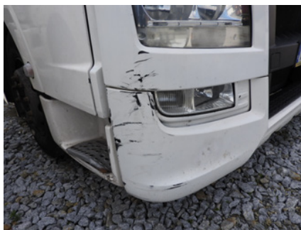
Wgniecione, wygięte i odkształcone zderzaki.