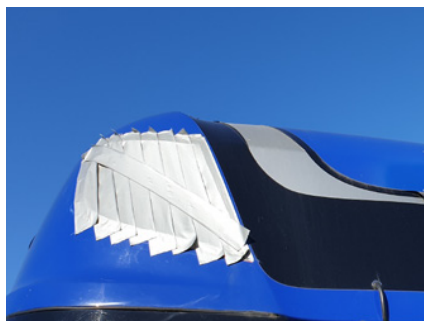
Złamania i pęknięcia spojlera.