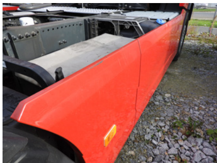
Lekkie zadrapania i rysy.