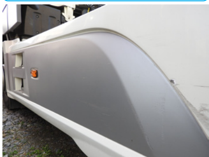
Drobne zarysowania powierzchni wynikające z codziennego użytkowania.