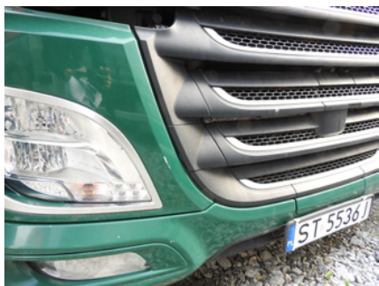
Niewielkie zarysowania i zadrapania.