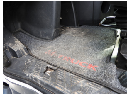
Uszkodzenia w elementach podłogi.