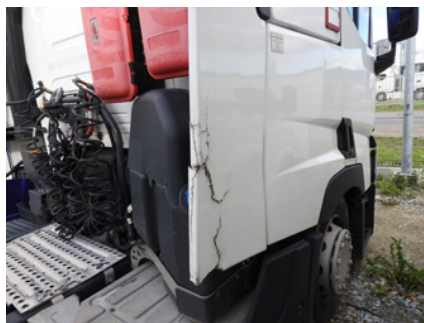
Złamania i pęknięcia osłon bocznych.