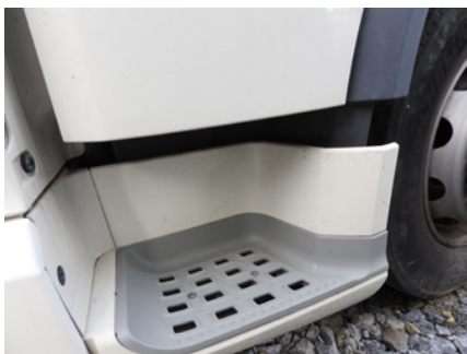
Lekkie zadrapania stopnia wejściowego.