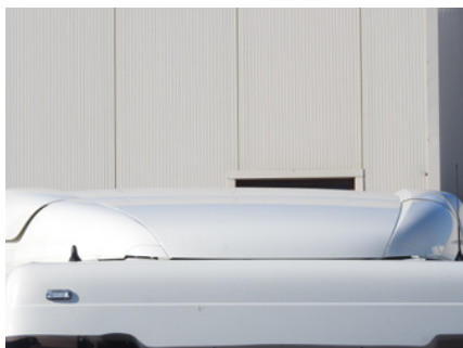
Zarysowania na powierzchni spojlera.