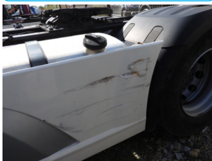
Pęknięcia i wgniecenia wskutek zderzenia.