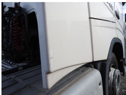
Niewielkie zarysowania na powierzchni osłon bocznych.