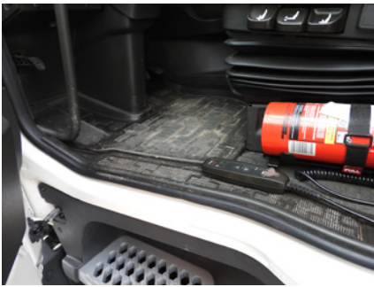
Lekkie zarysowania podłoża.